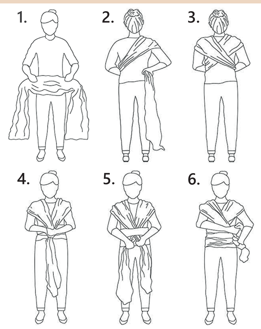
1.Rozložte šátek a najděte logo Minu. Logo značí střed šátku, který si položte vodorovně na břicho. 2.Volné konce veďte za záda a překřižte. Dbejte na to, aby se Vám šátek neprotáčel a zůstal rozložený. 3.Prekřížené konce veďte přes ramena dopředu. 4.Oba konce prostrčte pod vodorovným pruhem na břiše. Stále držte celý úvaz, tak aby zůstal napnutý. 5.Na břiše konce překřižte a veďte je kolem pasu. 6.Za zády, vepředu nebo na bedrech uvažte dvojitý uzel. Ujistěte se, že šátek máte uvázaný těsně a zároveň s dostatečným prostorem pro miminko.